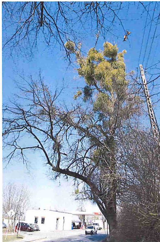
Lipa nr 2. Silnie rozbudowana konar nad jezdnią z licznym posuszem; korona silnie porażona jemiotą, asymetryczna w kolizji z przewodami napowietrznej linii energetycznej.