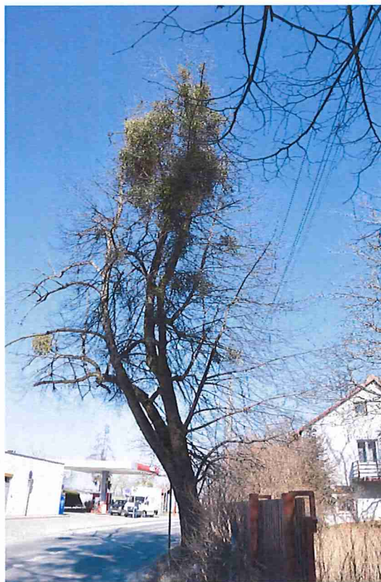
Lipa nr 1. Trzy przewodniki, z czego 2 obumarłe; pień pochylony, korona zniekształcona, asymetryczna, silnie porażona jemiotą. Część korony bezpośrednio nad pasami ruchu pojazdów.