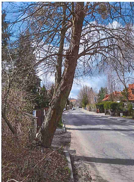
Lipa nr 3. Pień wygięty, pochylony, wrasta w światło drogi, znacznie utrudnia widoczność przy wyjeździe. Korona asymetryczna ze skupiskami jemioty.