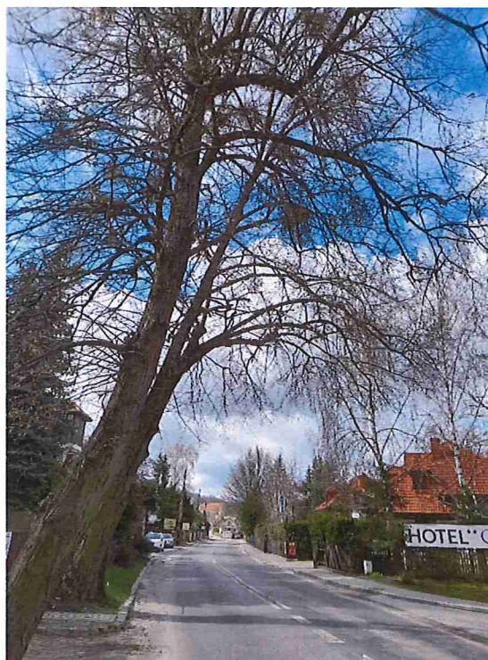
Lipa nr 4 Pień pochylony w stronę drogi, przewodniki wrastają w światło drogi. Lokalizacja uniemożliwia wręcz widoczność przy wyjeździe. Korona asymetryczna ze „słabymi” rozwidleniami przewodników i skupiskami jemioty.